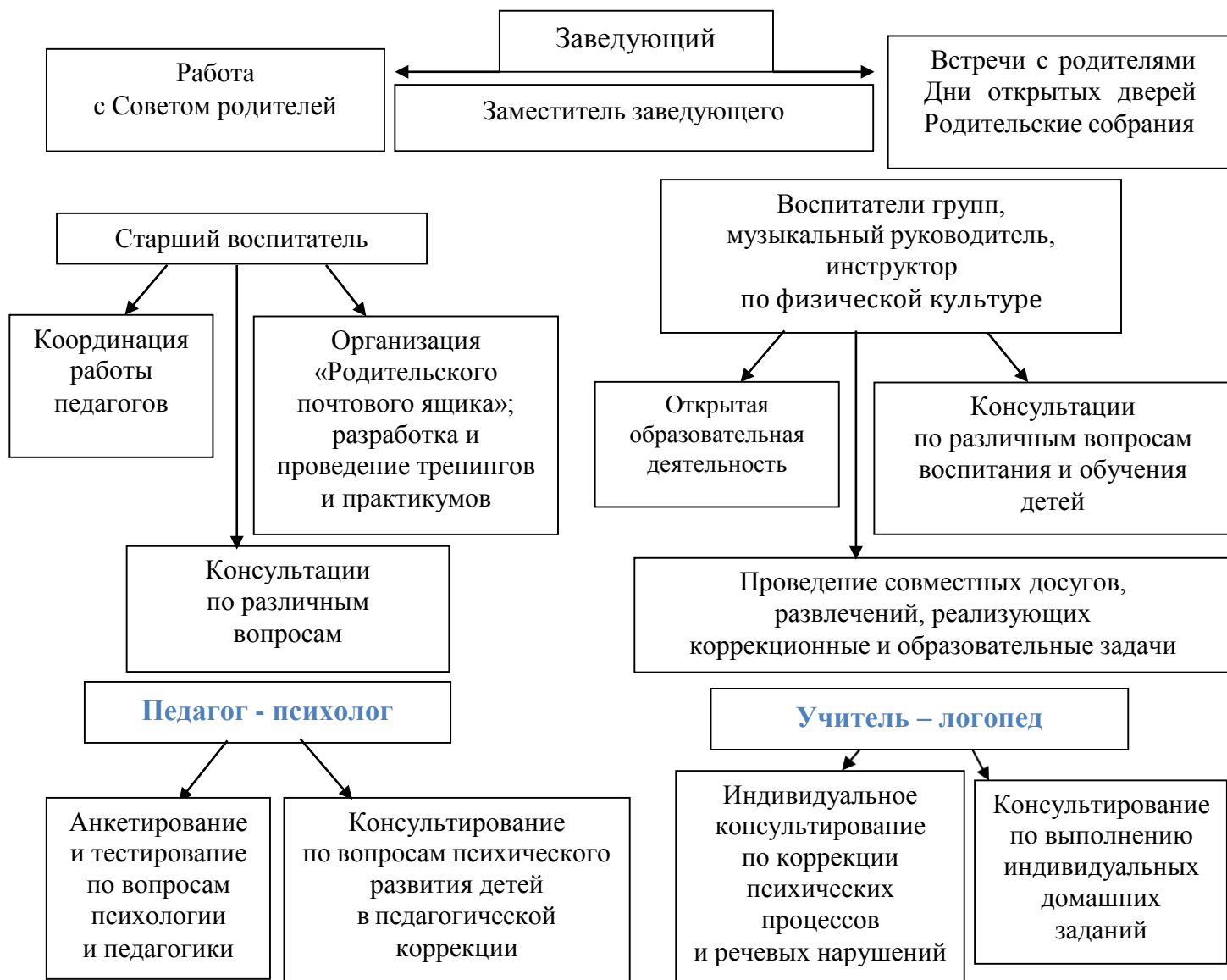
Рис. 1 «Схема взаимодействия с семьями воспитанников»