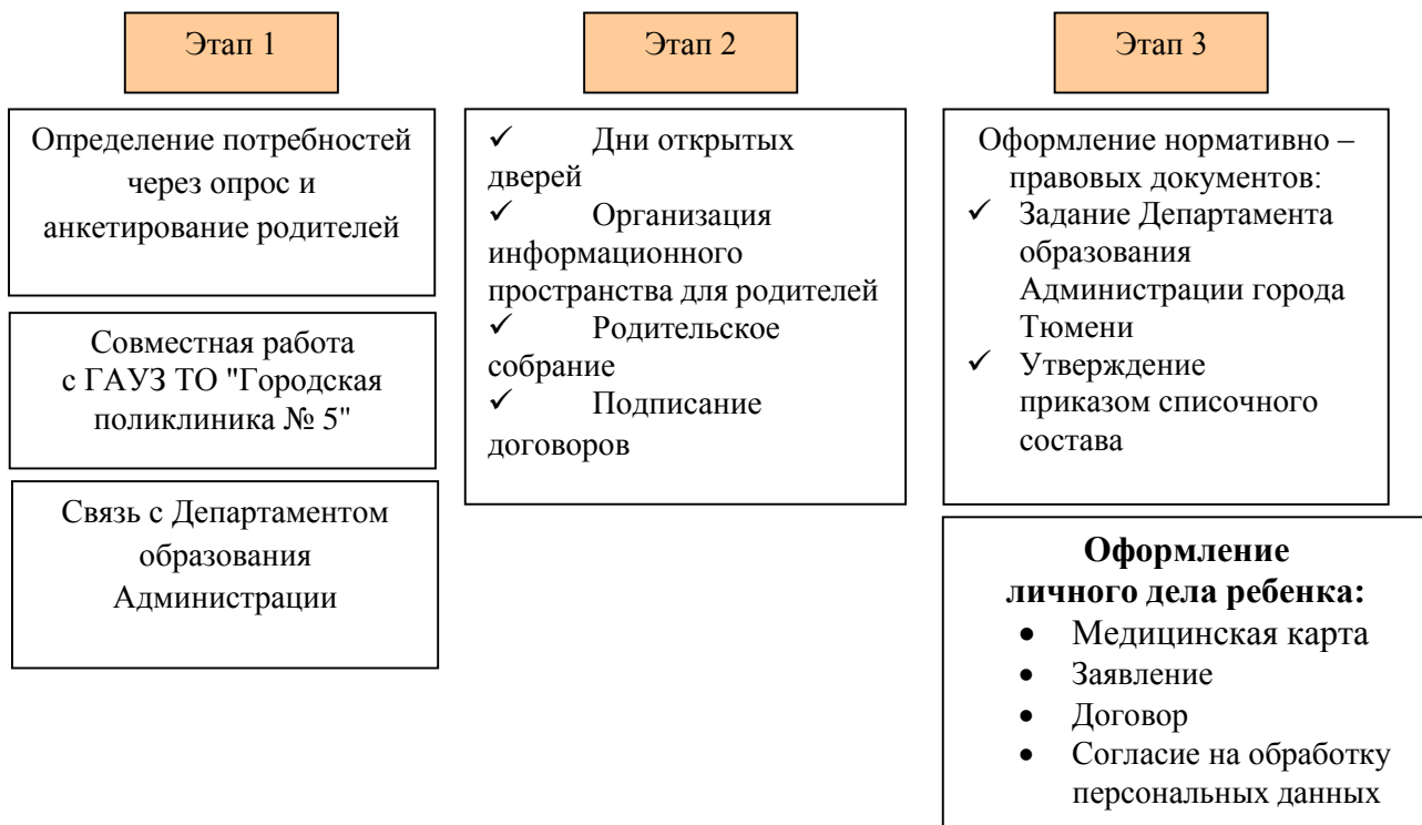
Рис. 3. «Этапы организации детей КМП»

С целью изучения степени удовлетворенности родителей качеством образовательных услуг консультационно – методического пункта, предоставляемых дошкольным образовательным учреждением, условиями пребывания их детей в детском саду, с целью выявления мнения родителей о получении образовательных услуг, а также возможные пожелания предусмотрено проведение социологического исследования удовлетворенности родителей качеством услуг консультационно – методического пункта, предоставляемых образовательным учреждением в периодичности 1 раз в квартал средствами анкетирования.